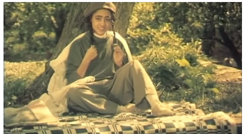
تصاویر ۶ تا ۸. فیلم درخت گلابی، فیلمبردار: محمود کلاری، تدوینگر: مصطفی خرقةپوش.

پیوند می‌خورد و یا در ادامه با حرکت عمودی رو به بالای دوربین بر محور ثابت (تیلت آپ) روی درخت گلابی در زمان حال، مخاطب شاهد برش زمانی از حال به گذشته است که میم در نمای دوم در بالای درخت گلابی است. همچنین این مورد در نماهای انتهایی فیلم نیز دیده می‌شود؛ زمانی که محمود سرش را بالا می‌برد تا درخت را نگاه کند، دوربین با حرکت سر محمود حرکت عمودی رو به بالا بر محور ثابت (تیلت آپ) دارد و به نمایی از محمود نوجوان برش می‌خورد که از درخت بالا می‌آورد و در بالای درخت نگاهش به تار عنکبوتی است (تصاویر ۹-۱۰).