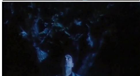
تصاویر ۹ و ۱۰. فیلم درخت گلابی، فیلمبردار: محمود کلاری، تدوینگر: مصطفی خرقةپوش. مأخذ: (تصاویر برگرفته شده از فیلم)