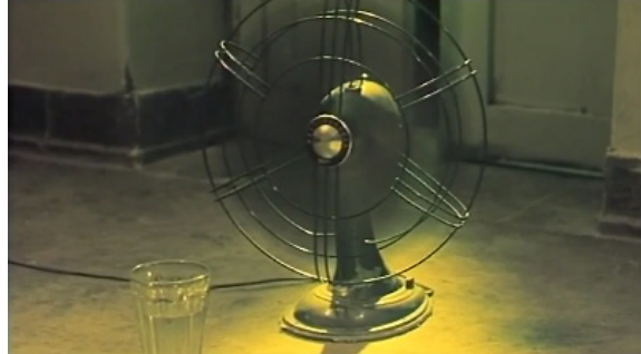
تصاویر ۱۹ و ۲۰. فیلم درخت گلابی، فیلمبردار: محمود کلاری، تدوینگر: مصطفی خرقة‌پوش. مأخذ: (تصاویر برگرفته شده از فیلم)

شد این گونه به تصویر کشیده شده اند، و پراندن مگس توسط میم، می تواند خاطراتی از زندگی خویش را به یاد آورد. پس در این صحنه مخاطب تنها نظاره گر خاطرات محمود نیست بلکه خاطرات خودش را نیز به یاد می آورد. پس این خاطره کارکردی نوستالژیک را در فیلم داراست (تصویر ۲۰).