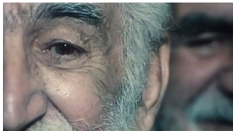
تصاویر ۱۱ و ۱۲. فیلم درخت گلابی، فیلمبردار: محمود کلاری، تدوینگر: مصطفی خرقةپوش. مأخذ: (تصاویر برگرفته شده از فیلم)