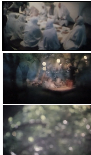
تصاویر ۳ تا ۵. فیلم درخت گلابی، فیلمبردار: محمود کلاری، تدوینگر: مصطفی خرقه‌پوش. مأخذ: (تصاویر برگرفته شده از فیلم)

وضوح و تجربیدی است؛ گویای تلاش او برای یادآوری خاطراتش. تصاویر با گذر زمان واضح می‌شوند و محمود درختی را به یاد می‌آورد که کدخداسخن از خشک شدن آن به میان آورده است. او تصاویری از درخت گلابی را به یاد آورده است. در ادامه‌ی همین یادآوری خاطره تصاویر از نگاه محمود خارج از وضوح هستند. فیلمساز با وضوح و خارج از وضوح (فلو) کردن تصویر سعی بر نشان دادن بازی حافظه برای یادآوری جزئیات دارد. محمود سفره غذا را گاهی اوقات واضح می‌بیند اما افراد نشسته بر دور آن اغلب قابل شناسایی نیستند، زیرا خارج از وضوح هستند. محمود کلیات خاطره را به یاد دارد. او به تاریکی نگاه می‌کند که میم از درون آن بیرون می‌آید و با نزدیک شدن به محمود واضح می‌شود. میم نیز متقابلاً به محمود چشم دوخته است. محمود میم را واضح‌تر از هر چیز دیگری به یاد می‌آورد و حتی نگاه او را در خاطرات به یاد دارد زیرا تنها به جزئیات او توجه داشته و آن‌ها را از بر شده است. (تصاویر ۳-۵) محمود در انتهای فیلم نیز خاطره‌ای دیگر را به مانند خاطره‌ی پیشین به یاد می‌آورد. در این خاطره تصویر خارج از وضوح است و افرادی که از جلوی دوربین می‌گذرند قابل تشخیص نیستند، درست مانند افراد اطراف سفره، اما دوربین به میم می‌رسد و تصویر واضح می‌شود. تنها اوست که قابل تشخیص است و در خاطرات محمود حضوری واضح دارد.