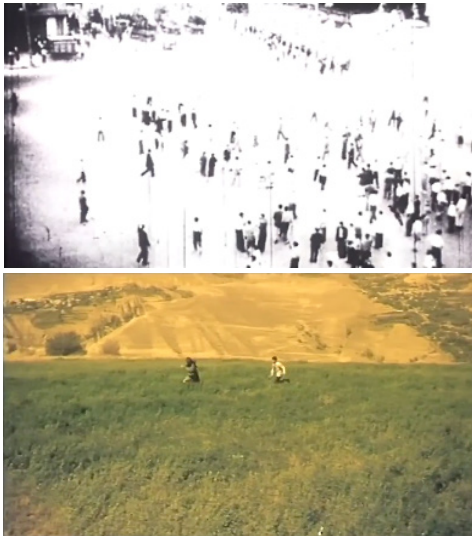
تصاویر ۱ و ۲. فیلم درخت گلابی، فیلمبردار: محمود کلاری، تدوینگر: مصطفی خرقه‌پوش.

به خاطره‌ای به خصوص نیز به کار گرفته می‌شوند. بنابراین به طور کلی این روش از روش‌های رایج برای نشان دادن خاطرات است و نمونه‌ی نسبتاً کاملی از آن را می‌توان در فیلم درخت گلابی دید. در این فیلم رنگ برخی از تصاویر خاطرات به زردی میل می‌کند پس می‌توان گفت که مهرجویی برای تداعی کهنگی و بازنمایی رنگ تصاویر آنالوگ در سال‌های نوجوانی محمود، به بهره‌گیری از این کیفیت زیبایی‌شناسانه‌ی نوستالژیک روی آورده و رنگ فیلم‌های آنالوگ نور روز قدیمی را بازسازی کرده است. این رنگ جز مفهوم کهنگی، تداعی گرما و شادابی دوران نوجوانی را نیز می‌تواند به همراه داشته باشد. محمود در علفزار به دنبال میم می‌دود و نگاه به او زندگی را به کامش شیرین کرده تا حدی که محمود در زمان حال و نریشن فیلم خود را در این تصاویر «خوشبخت خوشبخت» می‌داند. البته باید توجه داشت که فیلمساز در طول فیلم به شکل منسجم از تغییر رنگ بهره نچسته است (تصویر ۱) جز خاطراتی که میم در آن‌ها حضور دارد، خاطرات پس از میم نیز به تصویر کشیده می‌شوند. در این خاطرات مخاطب با تصاویر سیاه و سفید روبه‌رو می‌شود. زندگی محمود در این سال‌ها رنگی ندارد و این تغییر رنگ احساس محمود نسبت به خاطراتش بعد از میم را نشان می‌دهد. همچنین در بین نماهای این خاطرات نیز تصاویری آرشو وجود دارد که جنسی متفاوت از باقی خاطرات، دانه‌دار (گرینی) و پر خش، را به تصویر می‌کشند که سبب می‌شود مخاطب دیگر خاطره را تجربه‌ای دسته اول نشمارد (تصویر ۲).