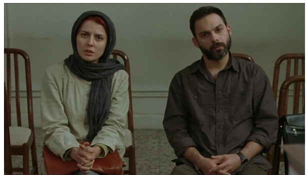
تصویر ۳- فرهادی با قرار دادن دوربین در زاویه نقطه نظر قاضی به شکلی کنایی به داوری مخاطب از شخصیت‌ها اشاره می‌کند.

با فرض ساختار و درونمایه بالا، فرایند بصری فیلم جدایی را تفسیر می‌کنیم. تیتراژ این فیلم از نمای داخلی یک دستگاه فتوکپی آغاز می‌شود. شناسانه‌هایی برای کپی، داخل دستگاه قرار می‌گیرند تا اینکه یک سند ازدواج در دستگاه گذاشته می‌شود و سپس یک نمای طولانی از گفتگوی نادر و سیمین با قاضی را داریم. در این سکانس-نما، به نظر می‌رسد که دوربین در جایگاه نقطه نظر ۱۲ قاضی نشسته است. استفاده از نقطه نظر، دو نتیجه به همراه دارد. از یک سو جدال و کشمکش میان نادر و سیمین را به دقت، به شکلی مداوم و با حضور هر دو می‌بینیم و دوم اینکه تماشاگر در جایگاه قاضی قرار گرفته است. فیلمساز از یک تکنیک بصری، برای انتقال معنا کمک می‌گیرد. وقتی مخاطب در جایگاه قضاوت‌کننده قرار می‌گیرد، به کنایه از او خواسته می‌شود که درباره این دو شخصیت قضاوت کند. یعنی یک تکنیک بصری به کنایه‌ای سینمایی تبدیل می‌شود و البته می‌توان آن را به کلیت فیلم تسری داد. این همان بصری کردن مفاهیم انتزاعی است که سیگرا از آن سخن می‌گوید. به نظر می‌رسد که