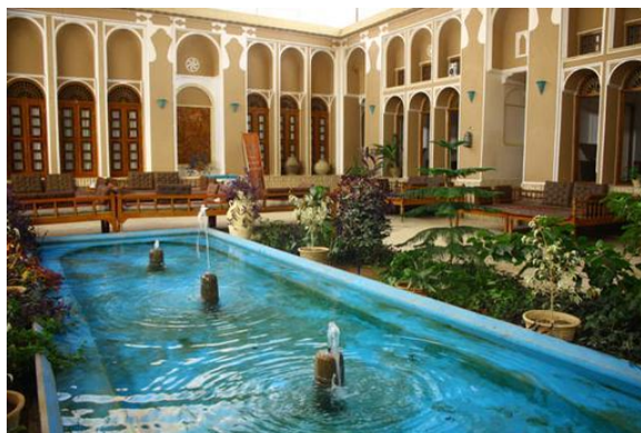
تصویر ۸. خانه مظفر در شهر یزد، از اماکن میراث معماری کویر مرکزی ایران. از آن به‌عنوان اقامتگاه گردشگران استفاده می‌شود.

علاوه بر فضاهایی که اصالتاً در آن‌ها فعالیت‌های موسیقایی شکل می‌گیرد، می‌توان اماکنی را که دارای پتانسیل‌های فرهنگی‌اند برای کاربردهای چندگانه، که اجرا یا آموزش موسیقی یکی از چنین کارکردهایی است، اختصاص داد. از باب نمونه، در مجموعه سعدی، در شهر شیراز، کارگاه‌هایی برای تولید و عرضه صنایع دستی این شهر اختصاص داده شده است که گردشگران این مجموعه، علاوه بر بهره‌مندی از فضای آرامگاه این شاعر نیکوسخن شعر فارسی، از این کارگاه‌ها دیدن می‌کنند.