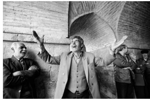
تصویر ۴. آواز خوانندگان حرفه‌ای و آماتور در زیر رواق‌های پل خواجه در اصفهان.

خوانندگان صاحب‌نام و خوانندگان جوان هر دو گروه از رواق‌های ایجادشده در زیر پل‌های خواجه و سی‌وسه‌پل برای خواندن آواز استفاده می‌کرده‌اند. امروزه گردشگران دقیقی را در این رواق‌ها می‌نشینند. این دقایق برای آنان یادآور آوازهایی است که در این مکان خوانده می‌شده است. برخی گردشگران با قرارگرفتن در این فضا خود نیز حال و هوای آواز خواندن پیدا می‌کنند و برای خود آوازهایی زمزمه می‌کنند (تصویر ۴).