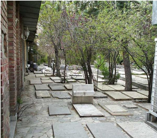
تصویر ۶. آرامگاه ظهیرالدوله در منطقه دربند تهران.

در فرهنگ ایرانی آرامگاه اشخاص از جایگاه خاصی برخوردار است. ایرانیان با حضور بر سر مزار افراد موردعلاقه خود، ضمن بزرگداشت آنان، از نیکی‌های آنان یاد می‌کنند. هنرمندان از قدیم‌الایام در اماکن خاصی خاک‌سپاری می‌شده‌اند و افراد برای ادای احترام و یادکرد آنان به این اماکن مراجعه می‌کرده‌اند. یکی از این مکان‌های مهم آرامگاه ظهیرالدوله است که شمار زیادی از هنرمندان موسیقی ایران در آن آرمیده‌اند (تصویر ۶). این آرامگاه یکی از قطب‌های گردشگری موسیقی تهران شناخته می‌شود. ایرج‌میرزا در سال ۱۳۰۴ و درویش‌خان در سال ۱۳۰۵ نخستین هنرمندانی بودند که در این گورستان به خاک سپرده شدند و بعدها نیز افرادی مانند ابوالحسن صبا و قمرالملوک وزیری در این مکان دفن شدند.