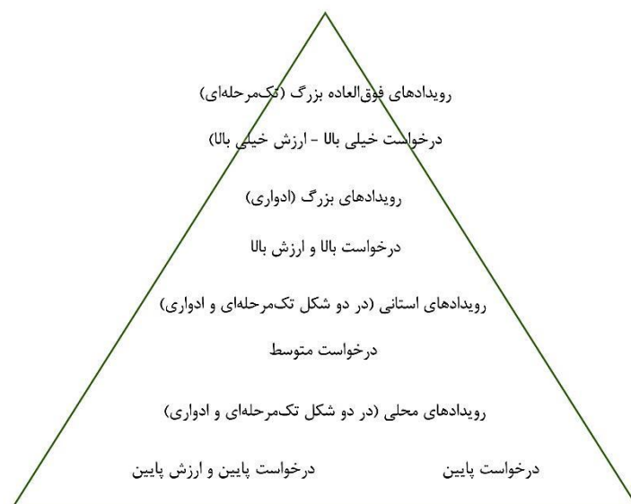
تصویر ۲. هرم انواع رویدادهای گردشگری براساس میزان اهمیت، تناوب تکرار، و بهره‌های اقتصادی.

بر اساس دو متغیر گستره رویداد و میزان استقبال از آن‌ها، گتز (Getz, 2005) هرمی را پیشنهاد می‌کند (تصویر ۲). تجزیه و تحلیل طبقات این هرم به برنامه‌ریزان گردشگری رویداد کمک می‌کند تا رویداد خود را از نظر گستره و میزان اقبال مخاطب طراحی کنند.