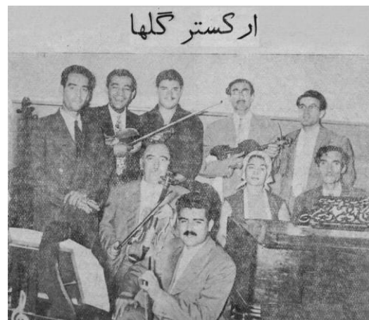
تصویر ۵. صبا و ارکستر او در استودیوی گل‌ها در رادیو ایران، ۱۳۳۶.

استودیوهای قدیمی که خوانندگان و نوازندگان آثار ماندگار خود را در آن‌ها ضبط کرده‌اند برای خود این هنرمندان و علاقه‌مندان به آن آثار همواره بسیار خاطره‌انگیز است. در ایران استودیوهای قدیمی بسیاری هست که بیشتر آن‌ها مربوط به رادیو و تلویزیون ملی ایران است. تعدادی استودیوی خصوصی در ایران هست که اغلب آن‌ها در شهر تهران قرار دارد. تصویر ۵، که در استودیوی گل‌ها در رادیو گرفته شده است، صحنه‌ای به‌یادماندنی از نواهای آن روزگار را توسط ابوالحسن صبا و سایر نوازندگان ارکستر او در سال ۱۳۳۶ به نمایش می‌گذارد.