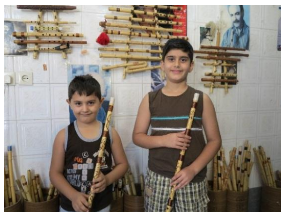
تصویر ۷. گردشگران در حال بازدید از کارگاه خصوصی ساخت سازهای بادی در مرودشت استان فارس. این کارگاه‌ها یکی از جاذبه‌های گردشگری موسیقی در این شهرستان است

سازسازها در اغلب اوقات خود نیز نوازنده‌اند و برای ساخت ساز از ابزارهای محلی استفاده می‌کنند؛ همین امر بازدید از کارگاه‌های آنان را برای گردشگران مهیج‌تر می‌کند. در کشور ما تقریباً در اغلب موارد سازهای محلی در خود منطقه ساخته می‌شوند؛ از همین روی، می‌توان گردشگری سازسازی را یکی از شیوه‌های مؤثر در رونق گردشگری موسیقی و آورده‌های اقتصادی آن برای محل برشمرد.