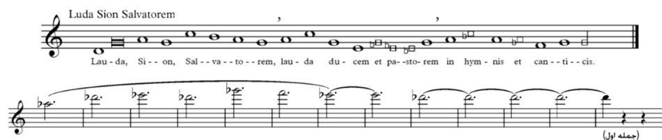
تصویر ۱۳- ملودی کُرال Lauda Sion Salvatorem ، میزان ۴۸۱-۴۶۹.

شروع آله‌لویا توسط سازهای بادی برنجی و بسیار با شکوه ارائه می‌شود. این بخش سه عبارت موسیقایی دارد که در آنها از تکنیک استرتو- فشردگی- استفاده شده است. ارکستر با فیگورهای باروکی و حمایت قدرتمندانه‌ای از عبارت‌ها در اونیسون، نمایشی را از رهایی سنت‌آنتونی از مخمصه‌ای که به دلیل وسوسه دچار آن شده بود، به نمایش می‌گذارد. در پایان موسیقی به شکرانه‌هایی سنت‌آنتونی از یک آله‌لویای سرورآمیز هموفونیک همچون یک اوراتوریوی باشکوه استفاده می‌کند.