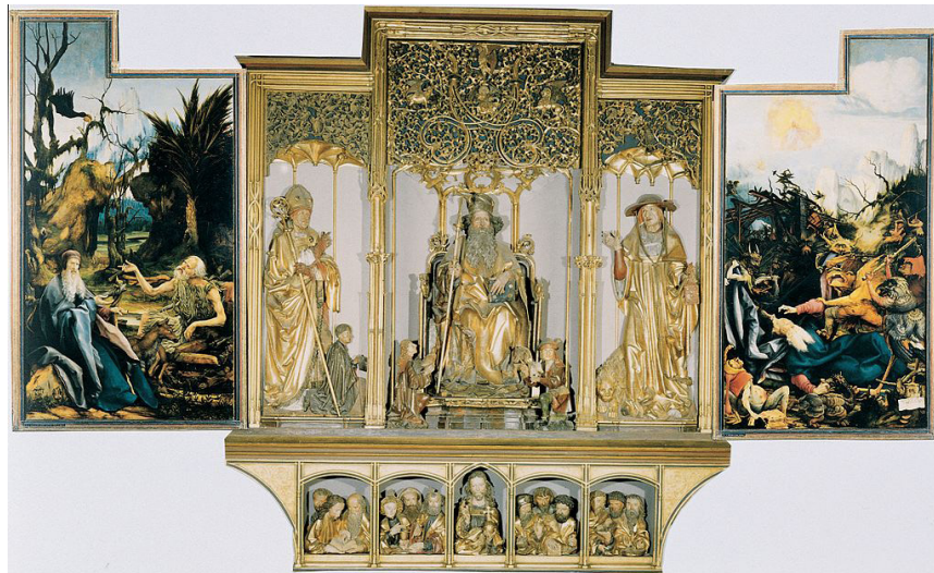
تصویر ۲- تابلو سه پرده‌ای با قابلیت جمع شدن از دو بال کناری به همراه تعدادی مجسمه در بال وسط. از ماتیاس گرونوالد نقاش آلمانی دوره رنسانس.

اما نقاشی‌های این تابلو نمایشی وحشت‌آور از قدیس سنت آنتونی ۲۵ است که در حال مبارزه با وسوسه‌های شیطنانی می‌باشد. این تابلو نمایانگر «علاقه‌ی گرونوالد به نقاشی منظره‌های غیرزمینی و نمایشی میان دو دنیای آسمانی و زمینی و یا دوزخی است» (مشتاق، ۱۳۹۰، ۱۳۸) که می‌توان به صورت کامل استفاده از رنگ‌ها و شخصیت‌پردازی‌های نقاشی را نمود فضای اکسپرسیونیستی کارش قلمداد کرد. «گرونوالد شخصیت مضطربی داشت و خط در آثارش دارای شخصیتی باز و مشوش می‌باشد. خط در آثار گرونوالد بیانگر نیروی درونی انسان هاست» (همان). جدای از دیگر ویژگی‌های نقاشی دوره رنسانس همچون تاکید بر انسان در تصویر، وجه مادی بخشیدن به نقاشی‌ها، نمایش از طبیعت و مواردی دیگر، استفاده از رنگ‌های تیره، نمایش موجودات فرازمینی و شخصیت درونی انسان‌ها همچنین استفاده از عناصر و شخصیت‌پردازی انسان‌های قرون گذشته گرونوالد را یک اکسپرسیونیست وابسته به سنت نوکلاسیک در زمان خود معرفی می‌کند. «گرونوالد با استفاده از رنگ‌های خالص و تنظیم آنها در تابلو، به یک سمبولیزم جهانی دست یافت» (همان). موضوعی که برای نقاشان اکسپرسیونیست قرن بیستم همچون ماکس بکمان ۲۶ نیز جالب توجه بوده و مورد استفاده قرار گرفته به گونه‌ای که «پرده سه لتی عزیزمت، بازتابی از ستایشی بود که او از گرونوالد به عمل می‌آورد. در دولت جانبی با جهانی کابوس‌وار سرشار از پیکره‌های عروسک مانند و دلهره‌آور همچون دوزخ در نقاشی‌های هیرونیوس بوس ۲۷ و گرونوالد روبرو می‌شویم» (جنسن، ۱۳۹۰، ۹۷۸).