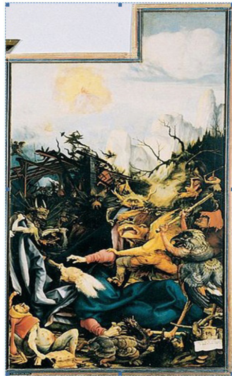
تصویر ۱۲- تصویری از بال کناری از تابلو سه پرده‌ای، ماتياس گرونوالد نقاش آلمانی دورهٔ رنسانس، وسوسهٔ سنت‌آنتونی. ماخذ: ( http://www.ibiblio.org/wm/paint/auth/grunewald/grunewald.isenheim-tempting.jpg )