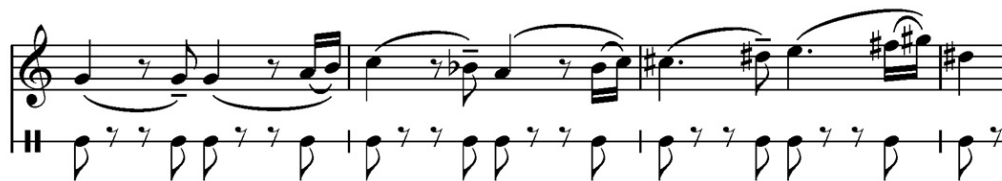
تصویر ۱۰- شروع موومان دوم، میزان ۴-۱. ماخذ: (سمفونی ماتیاس نقاش هیندمیت، موومان دوم)