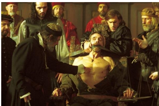
تصویر ۳. نمایی از فیلم تاجر ونیزی به کارگردانی مایکل رادفورد، ۲۰۰۴

شایلاک نماینده اقتصاد سنتی است و آنتونیو، که کشتی‌هایش به طرابلس ۳۱ و جزایر هند رفته‌اند، نماد اقتصاد نو و سلطه‌گر دوران الیزابت است و به گفته شایلاک، «ثروت او جنبه نامعلوم و فرضی دارد» (پرده اول، صحنه سوم). پس در این رقابت اقتصادی که بر سرمایه اقلیت تکیه دارد، شایلاک مورد تبعیض قرار می‌گیرد و اقتصاد به عاملی برای تحت‌شعاع قرار دادن قدرت تبدیل می‌شود: «شایلاک: من و معاملات من و ربی را که برای کسب آن زحمت کشیده‌ام، و او نام رباخواری بر آن می‌گذارد، مسخره می‌کند» (پرده اول، صحنه سوم).