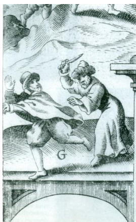
تصویر ۱. تعقیب توماس کوریات از یک یهودی چاقوبه‌دست، ۱۶۱۱ میلادی

بیگانه‌هراسی را برای اروپاییان به‌همراه داشت. از جمله این سیاحان، می‌توان به توماس کوریات ۲۱ اشاره کرد (تصویر ۱). یهودیان، پس از اخراج از کشورهای اروپایی، به آفریقا، به‌خصوص آسیا مهاجرت کردند، به طوری که در یک زمان بیش از ۲۵۰ هزار یهودی در امپراتوری عثمانی زندگی می‌کردند؛ جایی که نه تنها به تجاری موفق تبدیل شدند، بلکه به مناصب دولتی نیز دست یافتند. آن‌ها رقبای سرسختی برای تجار انگلیسی بودند که قصد تثبیت جایگاه خود را در منطقه داشتند. بسیاری از تجار انگلیسی باور داشتند با عیسوی کردن تجار یهودی (عیسوی کردن شایلاک در پرده چهارم صحنه اول نمایشنامه تاجر ونیزی) به اهداف خود می‌رسند.