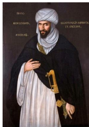
تصویر ۲. تصویر نقاشی شده از سفیر مراکش که برای ملاقات با ملکه الیزابت اول با هدف اتحاد مراکش و انگلستان علیه اسپانیا در سال ۱۶۰۰ میلادی وارد لندن شد

ب) روابط انگلستان با امپراتوری عثمانی و اعراب دادوستد بین مسلمانان آفریقایی و ترکان عثمانی با انگلستان در دوران الیزابت جایگاه مهمی داشت و از آنجا که هیچ‌یک از این اقوام ساکن بریتانیا نبودند، مسلمانان بیگانگی با هویت خاص محسوب می‌شدند. مسلمانان و ترکان نه جزو اقوام آواره، چون کولی‌های رومانیایی و یهودیان رانده‌شده، بودند و نه مانند سرخ‌پوستان آمریکایی تحت‌کنترل دولت بریتانیا (Matar, 1999: 20-53). از این‌رو، نگاه مردم انگلستان به مسلمانان با ترس و تحسین همراه بود که به‌ترتیب ناشی از پیشینه جنگ‌های صلیبی و قدرت اقتصادی امپراتوری عثمانی بود (تصویر ۲).