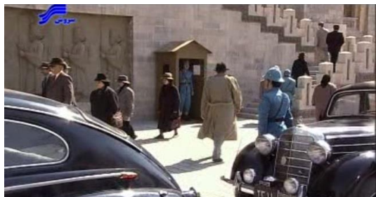
تصویر ۷. نمایی از محوطه‌ی مقابل ورودی اصلی ساختمان شهربانی

انتخاب دو لوکیشن داخلی و خارجی مجزا و ظاهراً بدون ارتباط با یکدیگر برای ساختمان شهربانی، اندیشه‌ی تعامل پلان و نما در ذهن طراح صحنه توانسته است انتخاب‌های درست و هماهنگی را برای وی به همراه بیاورد.