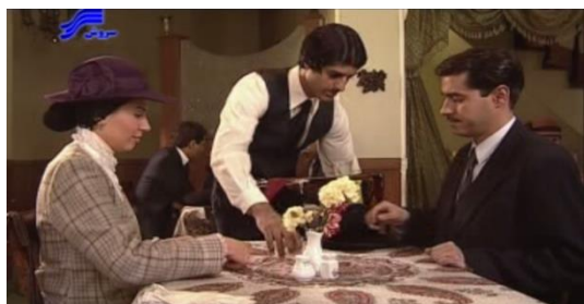
تصویر ۸. سالن اصلی گرند هتل

یکی از لوکیشن‌هایی که چندین بار در این مجموعه با زوایای مختلف به نمایش درآمده است، کافه رستوران گرند هتل - بازسازی‌شده‌ی آن در مجموعه‌ی "شهرک سینمایی غزالی" - است. این کافه که در واقع جزئی از مجموعه‌ی زیبا و باارزش خیابان لاله‌زار بوده است، تمامی ویژگی‌های خاص این خیابان را در خود جمع کرده است و به نمایش می‌گذارد (تصویر ۸).