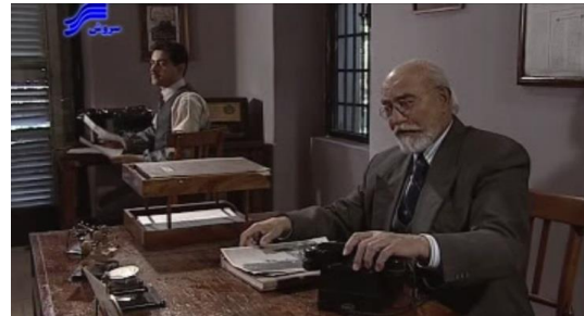
تصویر ۵. دفتر روزنامه حبیب

گذاشته می‌شود، ساختمانی است که دیوارهای داخلی آن خاکستری بوده و کف داخل آن نیز از موزاییک پوشانده شده است. در و پنجره‌های آن از چوب قهوه‌ای است و پنجره‌ها به‌صورت مشبک‌های بسیار ریز که مانع دید از بیرون می‌شود، ساخته شده است (تصویر ۵).