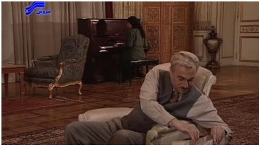
تصویر ۳. سالن پذیرایی خانه زینت‌الملوک

از سوی دیگر در دوران پهلوی اول، استفاده از آجر در بنا به‌علت سرعت و سهولت در اجرا، رواج بیشتری یافت. ضمن آنکه رویکردی به عناصر حجمی و مجسمه‌سازی با نگاهی دوگانه به دوران باستان و مؤلفه‌های غربی به‌شکل مجسمه‌ها در میدان‌ها و اماکن اداری و عمومی به‌وجود آمد. این رویکرد جدید را می‌توان در ساختمان‌های کاخ دادگستری، ساختمان شهربانی، (باغ ملی) و ... به‌شکلی کاملاً محسوس مشاهده کرد. آنچه مسلم است، مدرنیسم التقاطی‌ای که خانواده زینت‌الملوک در این مجموعه از آن برخوردارند، به فضا‌سازی و معماری نیز راه می‌یابد و عمارتی را به‌وجود می‌آورد که ترکیبی از همین نگاه شرقی و معماری غربی را شامل می‌شود. «در دوران پهلوی اول، هنرمندان معماری ایرانی و غربی که سازنده بناهای دولتی و آموزشی و صنعتی بودند، برای اولین بار با نوعی انتخاب تاریخی روبه‌رو شدند. آنان باید می‌فهمیدند که از چه دوره چگونه و به چه مقدار انتخاب کنند» (صارمی و رادمد، ۱۳۷۶: ۱۴۵).