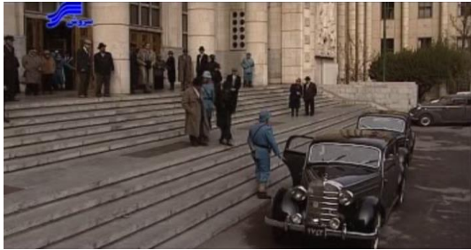
تصویر ۶. نمایی از مقابل ورودی اصلی کاخ دادگستری

عمدتاً آلمانی بودند- تغییرات، تزیینات و موتیف‌های سنتی ایرانی نیز به آن اضافه شد (تصویر ۶).