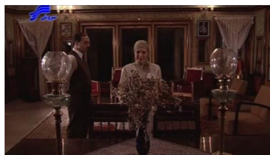
تصویر ۴. سالن پذیرایی خانه سعیده

چندین ستون برخوردار است. دیوارهای داخلی عمارت، از کاغذ دیواری‌های حاشیه‌دار پوشیده شده و کف آن با سنگ کرم‌رنگ فرش شده است. سقف بسیار بلند آن نیز با چوب‌هایی طرح‌دار پوشیده شده است. خصیصه بارز این عمارت، وجود در و پنجره‌های متعدد چوبی است که به صورت کشویی باز و بسته می‌شوند (تصویر ۴).