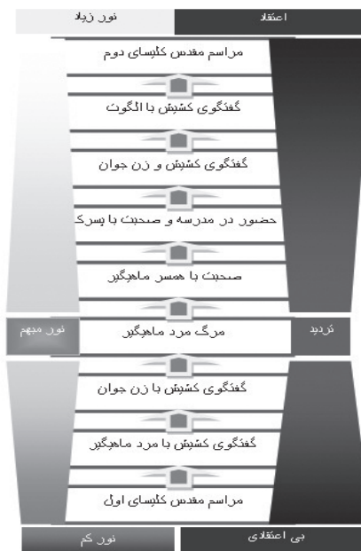
نمودار ۱- حضور نور و تاریکی در فیلم نور زمستانی.

فیلم نور زمستانی ساخته اینگمار برگمن ۱۰ که در نه سکانس اصلی شکل می‌گیرد، حکایت کشیشی به نام توماس اریکسون است که پس از مرگ همسرش، پایه‌های اعتقادیش سست شده است و خودش از سردی و بحران ایمان رنج می‌برد. با این وجود به ناچار و به موجب نوع شغل خود، مجبور است تا با دیگران ارتباط برقرار کند و آنان را به سوی خدا و ارتباط با او ترغیب نماید. برگمان قصد دارد تا در این فیلم با نگاه انتقادی، ضعف و سستی انسان عصر جدید در گرایش‌های دینی را به تصویر بکشد (نمودار ۱).