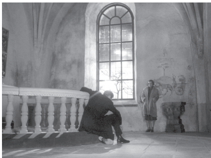
تصویر ۳- تابش نور الهی بر کشیش. ماخذ: (برگرفته از فیلم نور زمستانی)

پس از پایان گفتگوی یوناس و توماس، مارتا وارد کلیسا می‌شود. کشیش که با صحبت کردن با یوناس، گویی به نوعی اعتراف کرده است، دچار گونه‌ای دگرگونی می‌شود و بیان می‌کند که "این امید زودگذر را دارد که همه چیز تغییر می‌کند". در این صحنه که روشن‌ترین صحنه فیلم از نظر نور طبیعی محسوب می‌شود، نور بسیار خیره‌کننده‌ای از پنجره بلند رو به جنوب وارد کلیسا می‌گردد و مارتا و کشیش را در انبوهی از نور قرار می‌دهد. این نور بیان‌گر آن است که خداوند می‌خواهد حضور خود را به کشیش نشان دهد. ولی با رسیدن خبر خودکشی یوناس به کشیش، او دچار سردرگمی می‌شود (تصویر ۳).