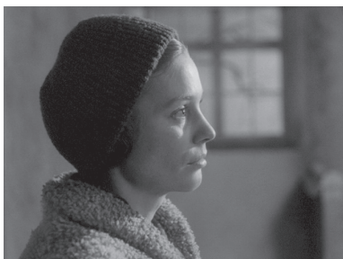
تصویر ۵- روشن شدن چهره مارتا.

نباید به ناامیدی تبدیل شود. این تجلی مسیح در لحظه شک مایه بصیرت او خواهد بود. بازگو کردن چنین شرایطی، کشیش را به خود می آورد و در این صحنه چهره کشیش نورانی تر می شود. در سکانس انتهایی فیلم، پس از شنیدن سخنان الگوت، کشیش دگرگون و نوری زیبا بر چهره او نمایان می شود. درست در همین زمان، چهره زن در تاریکی است (تصویر ۴). او با خود زمزمه می کند: "ایکاش می توانستیم از این پوچی به حقیقت ایمان بیاوریم". با شروع اجرای مراسم دینی و روشن شدن شمع ها، ابتدا چهره کشیش در نور قرار می گیرد و سپس دوربین به سمت زن که تنها عبادت کننده در کلیسا است بر می گردد و بسیار نورانی جلوه گر می شود (تصویر ۵).