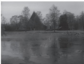
تصویر ۱- نمایی از دریاچه جلوی کلیسا در فیلم نور زمستانی.

سکانس ابتدایی فیلم، در نیمروز یکشنبه ای از اواخر ماه نوامبر اتفاق افتاده است. در چنین بافتی، پرتو خاکستری بیجانی بر دشت‌ها طنین افکنده، باد سرد تیره ای بر رودخانه کنار کلیسا به سمت شرق می‌وزد که بنا به اعتقادی در دین مسیح، نشان عبور روح مسیح از روی آب است. امتداد آن به گونه ای است که انگار از کنار کلیسا عبور کرده و بر آن گذر نمی‌کند (تصویر ۱). در این فضا، کلیسایی قرون وسطایی وصف می‌شود که بر روی تپه ای در میان دو دهکده هِل و جوپتون واقع شده است. فضایی منجمد و سرد که تازه بارش برفی سبک، ولی مداوم در کنار آن آغاز شده است و هفته‌ها است که زمین یخ بسته و پوسته سفید خاکستری گونه ای به آرامی جاده‌ها و کشتزارها را پوشانده است.