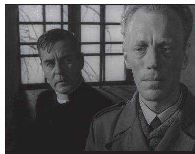
تصویر ۲- نمایی از گفتگوی کشیش و مرد ماهیگیر.

فیلم با مراسم مقدس آغاز شده است و با آن پایان می‌پذیرد. ولی تفاوت این دو سکانس در نوع اعتقاد انسان‌ها است که در کلیسا حضور دارند. به واسطه این تفاوت نیز، نورپردازی دو فضا باهم متفاوت می‌باشند. صحنه آغازین با شروع مراسم عبادی و نشان دادن بی‌تفاوتی و عدم شور و اشتیاق در چهره افراد شرکت‌کننده همراه می‌شود. در صحنه‌های ابتدایی فیلم در هنگام ادای مراسم مقدس، چهره‌هایی حال و بی‌روح است که همگی در دسته‌های کوچک رو به محراب ایستاده‌اند و در حال عبادت کردن می‌باشند.