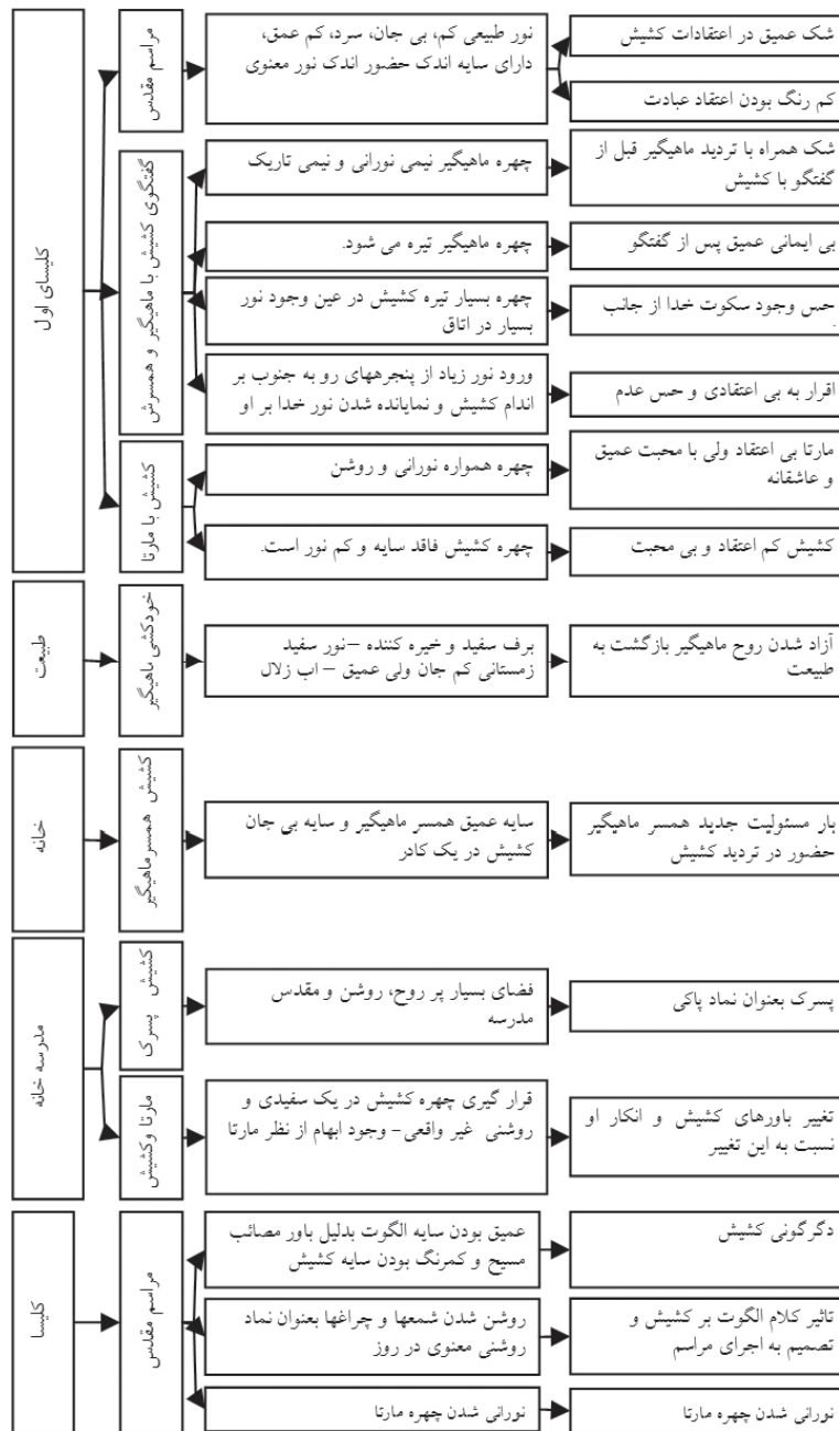
نمودار ۲- نمودار تحلیلی بررسی کیفیت نور در صحنه های مهم فیلم نور زمستانی.

نشان معصومیت است در کنار رودخانه در مورد ماهی عشق نور گفتگو می کند. او به دخترک می گوید که "این ماهی ها زمانیکه نور را می بینند به سمت آن می پرند تا مرکز نور را بیابند، ولی گاهی راه خود را گم می کنند و بر روی خشکی می افتند و به نوعی شهادت دست می یابند." پس از آن به آسمان نگاه می کند و به ابرها می گوید "که به هم نچسبید. بروید کنار بگذارید نور بیاید." اسد دارای جسمی "سیاه و سفید" شده است. در صحنه خودکشی اسد، با وجود نور بسیار خیره کننده آفتاب در درون، همه جا تاریک و خاکستری است. گویی او به نوعی به تناسخ بودیسم و پوچی رسیده است. در این هنگام ابتدا پرده های آبی و سپس کلبه می سوزد. شاید به اعتقاد