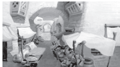
تصویر ۲- فضایی از فیلم علاءالدین و چراغ جادو [دیزاین تحت تاثیر فضاهای شرقی- ایرانی انجام شده است].

فرقی نمی کند که سبک یا تکنیک اجرایی یک فیلم انیمیشن چه باشد؛ در انیمیشن های با تکنیک نقاشی روی تلق، یا دیجیتال سل، یا برش مقوا ۱۹ و یا در انیمیشن های سه بُعدی رایانه ای و غیره؛ همیشه در مرحله پیش تولید، پیش طرح و اتودهایی از فضا توسط گروه طراحان فضا، طراحی و ارائه می شود که در این پیش طرح ها، وضعیت نور، سایه ها و خاکستری ها، ترکیب بندی، رنگ و حال و هوای کلی سکانس های مختلف فیلم، مشخص می شود. در مرحله بعد، همین پیش طرح ها به شکلی کامل تر و در قالب نماهای اصلی و پلان های معرف ۲۰ ارائه می شوند، این نماها راهنمای طراحان و نقاشان پس زمینه در مرحله تولید خواهد بود. همان طور که طراحی پزها ۲۱ و مدل شمیت ۲۲ کاراکترها توسط گروه طراحان کاراکتر، راهنمای متحرکسازان در مرحله تولید می باشد. باید همواره، تاثیرگذاری از طریق طراحی محیط و فضای اثر، مورد توجه هنرمندان تیم طراحی تولید باشد. وظیفه متمایز دیگر بر عهده طراحان فضا، این است که برای باورپذیر کردن فضاها باید قبل از خلق آنها به جستجو و تحقیق جامع بپردازند. این تصمیم، کاملاً به تم ۲۳ (محور اصلی)، موضوع یا شیوه روایت داستان فیلم بستگی دارد و شکل اجرایی آن را کارگردان هنری تعیین می کند. به عنوان مثال در انیمیشن سینمایی علاءالدین و چراغ جادو ساخته استودیو دیزنی، به دلیل اینکه حوادث فیلم در بغداد قدیم اتفاق می افتد و سبک و نوع معماری فضاهای شهر بغداد، شبیه به معماری ایران قدیم بوده، «رسول آزادانی» هنرمند ایرانی، به عنوان سرپرست گروه طراحان فضا، با سفری به شهرهای اصفهان، یزد و کاشان حدود ۶۰۰۰ قطعه عکس تهیه و آنها را مبنای طراحی ها و پیش طرح های اولیه برای فضای فیلم قرار می دهد (تصویر ۲).