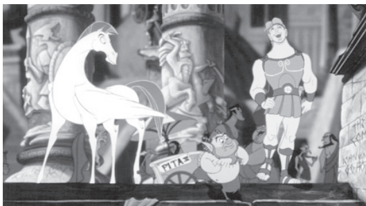
تصویر ۱ - انیمیشن سینمایی هرکول، [تفاهم اکسپرسیو در طراحی کاراکتر و طراحی فضا].

در پروژه های سینمایی و در سریال های انیمیشن تلویزیونی، دیزاین یا حال و هوای بصری و سبک و سیاق تصویری فیلم به دست هنرمندانی که تحت نظارت کارگردان اصلی و کارگردان هنری کار می کنند، تکمیل می شود. این گروه بنا به قابلیت هایشان به دو دسته تقسیم می شوند: گروه طراحان کاراکتر ۱۶ و گروه طراحان فضا ۱۷ . هر دو گروه برای ایجاد سبک مشترک بصری میان کاراکترها و فضاها، کاملاً هماهنگ عمل می کنند و مطابق طراحی مشخص شده و در چارچوب و برنامه مشخص سبک و تکنیک از پیش تعیین شده، مدل های خود را طراحی می کنند. کاراکتر و فضا، ابتدا در دو عامل مهم بصری یعنی فرم و رنگ به هماهنگی می رسند. به عبارتی اکسپرسیو یا بیان فرمی و رنگی موجود در کاراکترها باید با سبک بیان در فضا یکی باشد. به عنوان مثال به کاراکترهای فیلم انیمیشن هرکول ساخته استودیو دیزنی و هماهنگی آنها با فضاهای اطراف دقت کنید. نقاط مشترک زیادی میان اکسپرسیو خطوط و رنگ ها در کاراکترها و فضاهای زمینه می توان یافت (تصویر ۱).