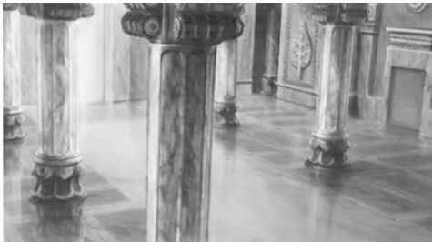
تصویر ۴- فضاهای انیمیشن «جمشید و خورشید» تحت تاثیر معماری دوره هخامنشی و ساسانی خلق شده است.