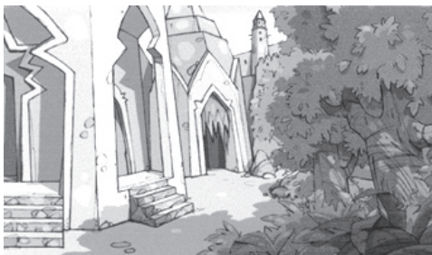
تصویر ۵- فضاهای انیمیشن تلویزیونی «پهلوانان» تحت تاثیر معماری ایرانی دوره ایلخانی قرار گرفته است. مأخذ: (سریال «پهلوانان»)

هماهنگی گرافیک مناسب با مضمون فیلم نامه، هماهنگی نور با مضمون فیلم نامه، هماهنگی زمینه ها با شخصیت ها (از نظر طراحی، رنگ و بافت)، هماهنگی طراحی فضا با زمان و جغرافیای وقوع داستان، هماهنگی طراحی فضا با تکنیک و نرم افزار اجرائی کار، هماهنگی طراحی اکسسوار با طراحی فضا و هماهنگی طراحی رنگ و بافت با سبک و تکنیک بصری فیلم، از جمله مواردی است که در ایجاد سبک بصری و فضاسازی موثر هستند.