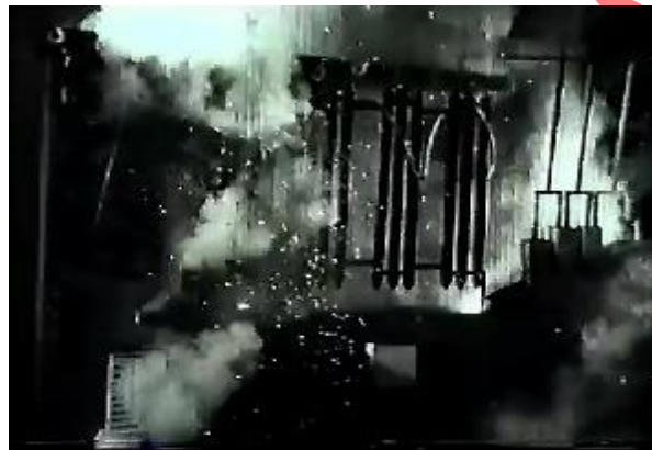
تصویر ۳. قیام اتوماتون و به ویرانی کشیدن آزمایشگاه پروفوسور.

یکی از الگوهای تکرارشونده در تاریخ روایت‌های اتوماتون‌ها و ربات‌ها، سرکشی مخلوق علیه خالق است؛ نمونه‌هایی از آن را می‌توان در متروپولیس (۱۹۲۷) و نمایشنامه آر. یو. آر. (۱۹۲۰) مشاهده کرد. موجود مصنوعی پس از مدتی از اطاعت مطلق خارج می‌شود و علیه آفریننده خود شورش می‌کند. فیلم چهارتا شیطان نیز در بستر ایرانی خود این الگو را بازآفرینی می‌کند. زن مصنوعی، که قرار بود به‌مثابه ابژه‌ای مطیع، تحقق فانتزی پدرسالارانه و تجسم فرمان‌برداری کامل از میل پروفوسور باشد، در پایان فیلم به نیرویی ویرانگر بدل می‌شود. او کنترل‌ناپذیر می‌شود، دستگاه‌ها را تخریب می‌کند و آتش به آزمایشگاه می‌افکند و در نهایت خود در شعله‌ها می‌سوزد؛ با این حال، پروفوسور از خطر مرگ نجات پیدا می‌کند. فیلم از همان ابتدا این شورش را نوید می‌دهد: فرشته خطاب به پدرش می‌گوید، «بالاخره به روز پیشمون می‌شی. به روز همین اختراع خودت باعث جونت می‌شه». این پیش‌گویی در پایان داستان تقریباً تحقق می‌یابد. به‌صورت نمادین، تبدیل ابژه منفعل میل به سوژه طغیانگر بیانگر هراس از نیروهای تکنولوژیک خارج از کنترل و زن مدرن است. آزمایشگاه، که نمادی از عقلانیت علمی و تسلط و کنترل انسانی است، در لحظه شورش بعد ویرانگر و مختل‌کننده نظم و نظامش آشکار می‌شود، که همان هراس و اضطراب توده عمومی از انقلاب فنی و سیطره تکنولوژیکی، و در این مورد خاص، ذهنیت ایرانی از مدرنیزاسیون شتاب‌زده است (تصویر ۳).