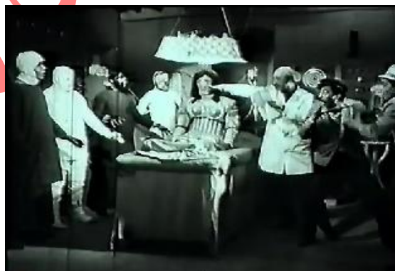
تصویر ۲. جشن و سرور با اتوماتون‌های ساخته شده توسط پروفوسور. ماخذ: تصویر برگرفته از فیلم چهارتا شیطون (۱۳۴۴).